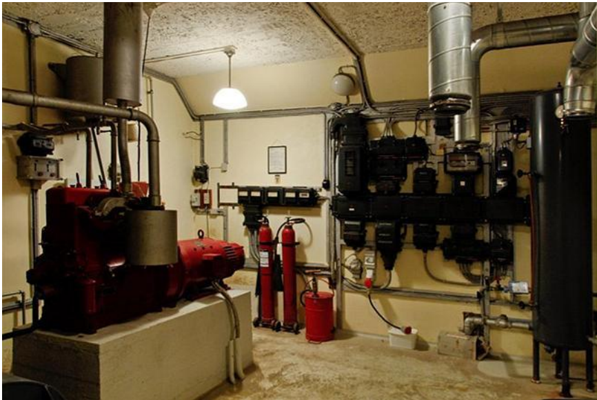
Eltavle og nødstrømsforsyning.