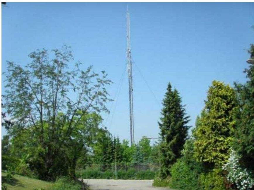
Mast på grunden. Siden 1999 har private telefonudbydere kunnet leje sig ind på masten.