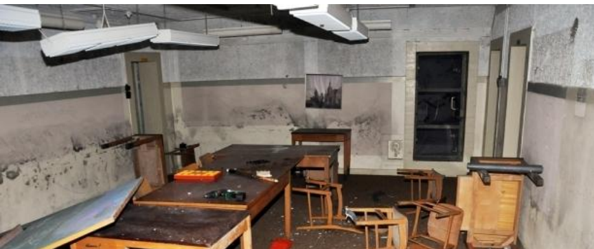
I 2011 var bunkeren i medierne, da den blev udsat for omfattende hærværk.

Bunkeren har egen mast. Der har formentlig også været en radiomast tilknyttet på KFK siloen på havnen.