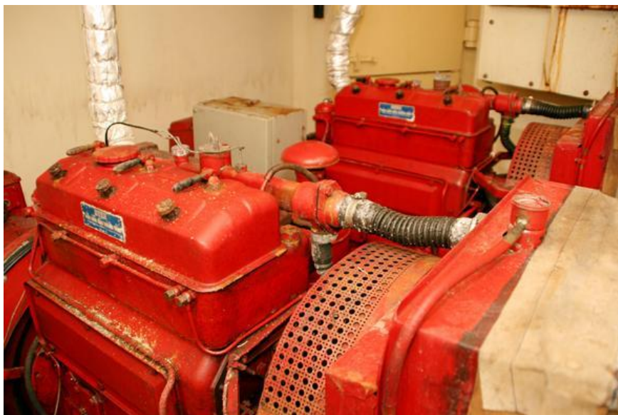
To stk. nødgeneratorer.