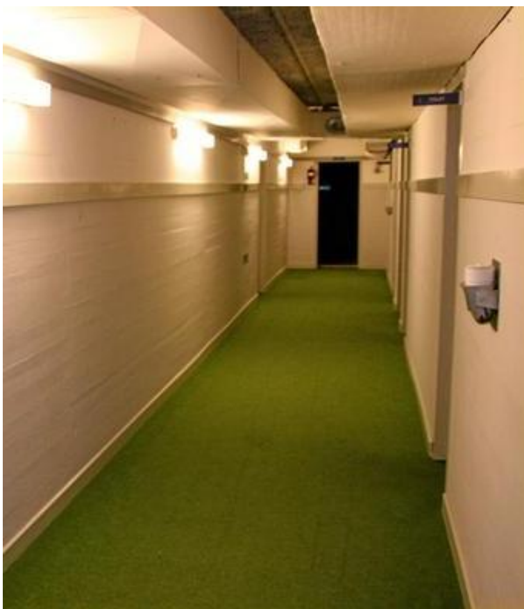
Indgang og fordelingsgang.