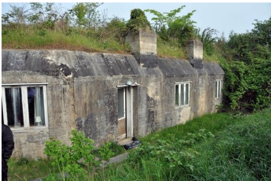
Bunkeren, som den ser ud i 2011 efter at være ombygget til sommerhus med vinduer og døre eftermonteret.